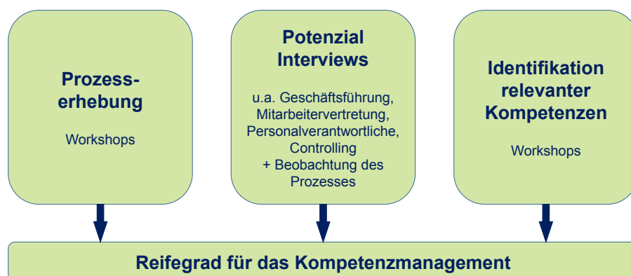
ABBILDUNG 2: Aktivitäten der ersten Erhebungsphase

Diese erste Erhebungsphase und ihre Aktivitäten dienen dazu, relevante Kompetenzen bezogen auf den identifizierten Pilotbereich zu erfassen. Alle dabei gesammelten Erkenntnisse fungieren als Input für die Reifegraddiagnostik für das Kompetenzmanagement. Aufbauend auf dem ermittelten Reifegrad wird ein betriebsspezifisches Kompetenzmodell erstellt und es werden Maßnahmen abgeleitet, die die Umsetzung eines strategischen Kompetenzmodells ermöglichen. ●