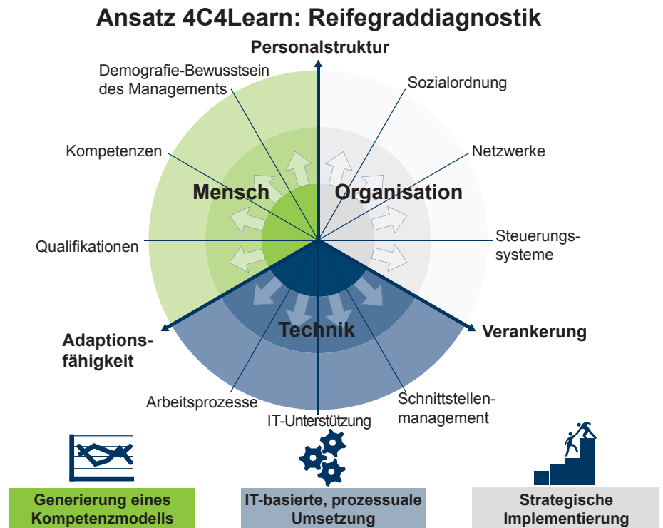
das Unternehmenscoaching an Reifegraden der Unternehmen an. Der Reifegrad bemisst sich an dem Integrationsniveau der für ein Kompetenzmanagement relevanten Handlungsfelder Mensch, Organisation und Technik sowie deren Verzahnung mit dem strategischen Management. Dabei werden sowohl Indikatoren für einzelne Dimensionen als auch für deren Verzahnung ermittelt (Abb. 1). Auf diesem Weg wird das Problem der unzureichenden Passung von Kompetenzansätzen für KMU-spezifische Entwicklungen überwunden.

beinhalten. Das Unternehmenscoaching 4C4Learn wird als hybride Produkt-Service-Leistung pilotiert, sodass die Tools auch für weitere Unternehmen unmittelbar nutzbar sind. Dazu werden gehören: EIN DIAGNOSE-TOOL zur Bestimmung des Reifegrades („Selbstcheck Reifegrad“).