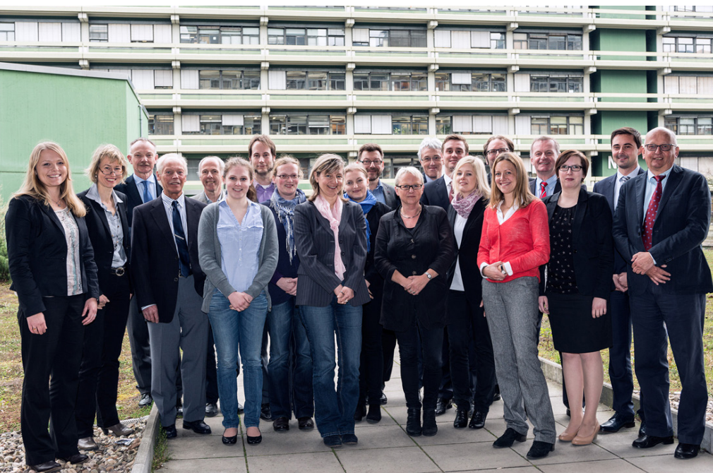
FOTO: Projektkonsortium beim Kick-Off-Meeting in Bochum