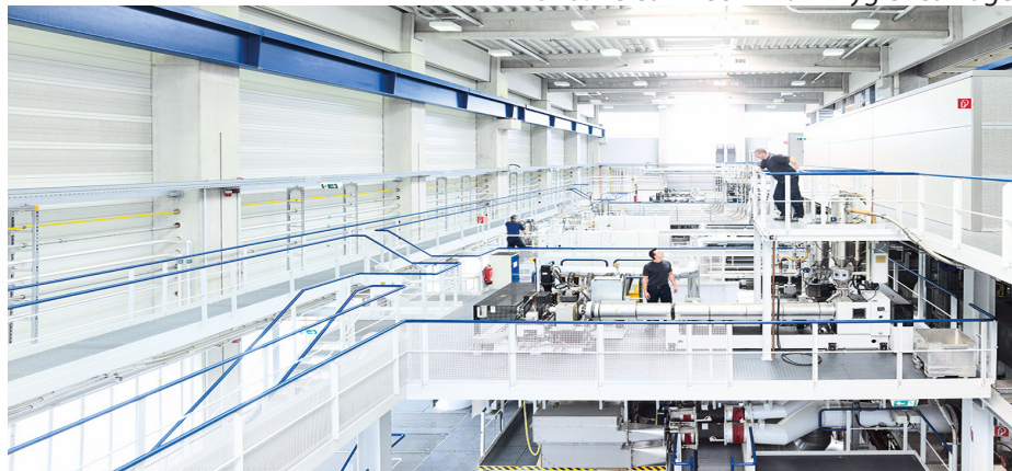
FOTO: Reicofil Technikum Hygieneanlage